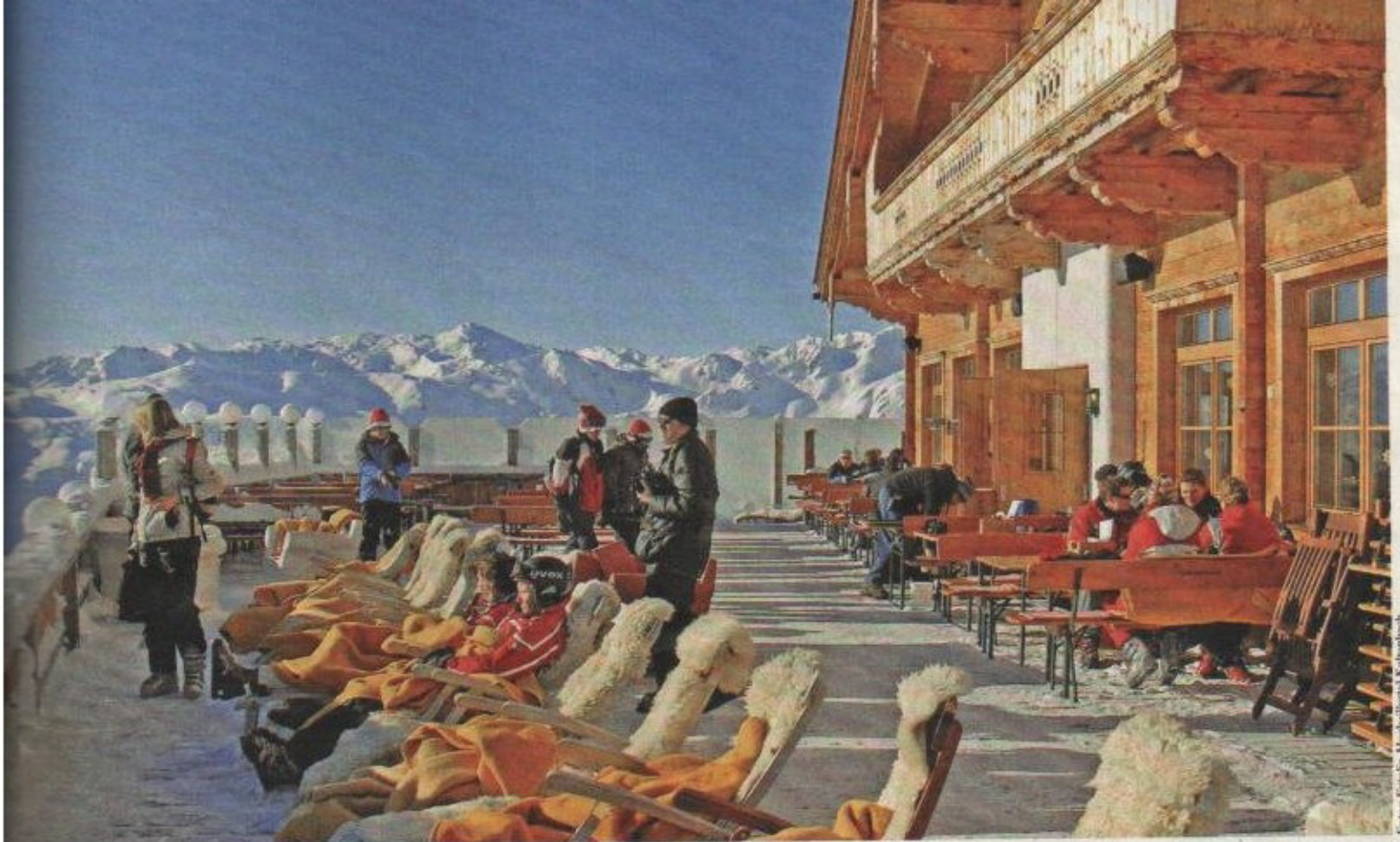
Hochalpenland-Kalbarbar