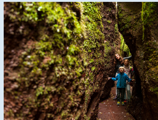
Drachenschlucht bei Eisenach

„Bei dieser Reise sind Sie in unserem eigenen Gästehaus untergebracht (siehe S. 4). So lernen Sie die herzliche Thüringer Gastfreundschaft kennen und gleichzeitig unterstützen wir Sie gerne bei der Planung Ihrer Tagestouren. Gerne beraten wir Sie auch zu weiteren Touren und möglichen Verlängerungsnächten.“