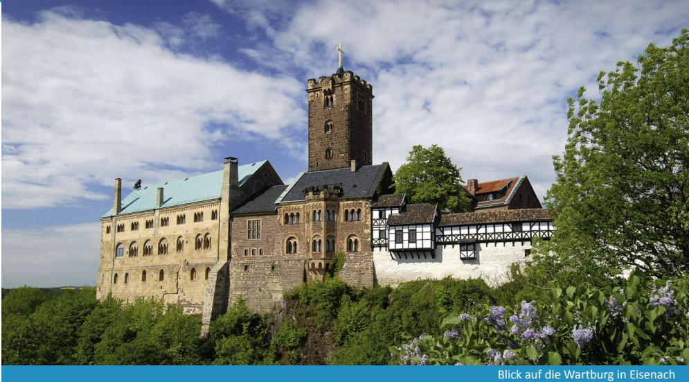
Blick auf die Wartburg in Eisenach