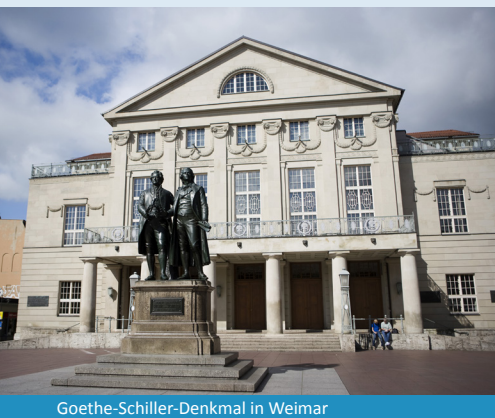
Goethe-Schiller-Denkmal in Weimar

Eine besondere Empfehlung ist die Kombination einer Weimar und einer Erfurt Sterntour. So lernen Sie nicht nur die Landeshauptstadt Thüringens sondern auch die Kulturhauptstadt des Freistaates bestens kennen.