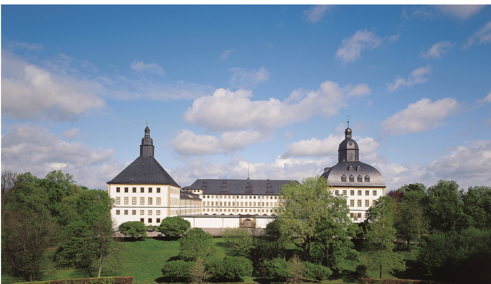
Schloss Friedenstein in Gotha