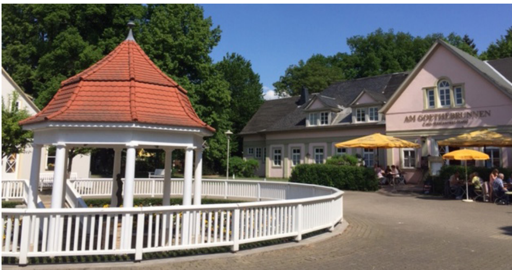
Goethe Brunnen in Bad Berka