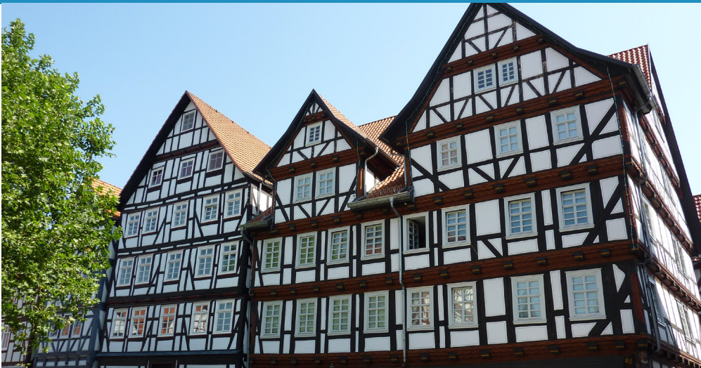
Fachwerk am Markt in Melsungen